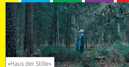
«Haus der Stille»