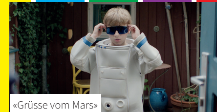
«Grüsse vom Mars»